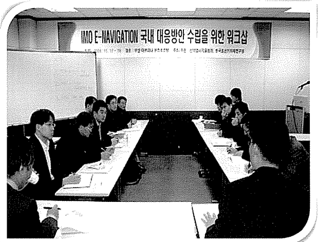
▲ 협회는 지난 11월 17일, 18일 양일간 부산 해운대 아르피나 유스호스텔에서 한국조선기자재연구원과 공동으로 IMO E-NAVIGATION 국내 대응방안 수립을 위한 워크숍을 개최하였다.