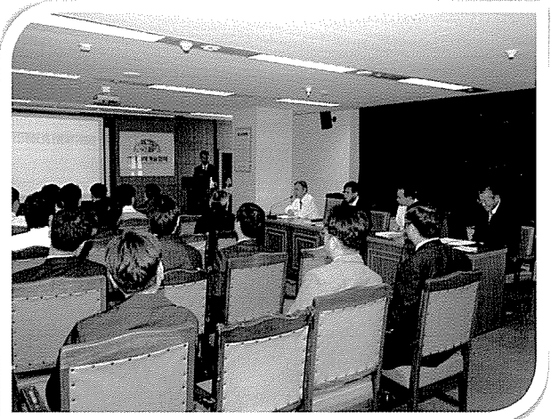
▲ 협회는 11월 16일 제7차 혁신학습토론회를 실시하였다.