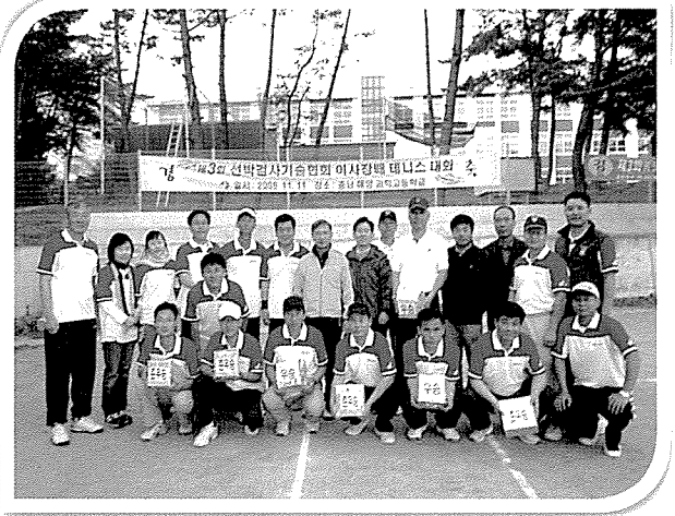
▲ 협회는 11월 11일 충남 대천에서 제3회 이사장배 테니스대회를 개최하였다.