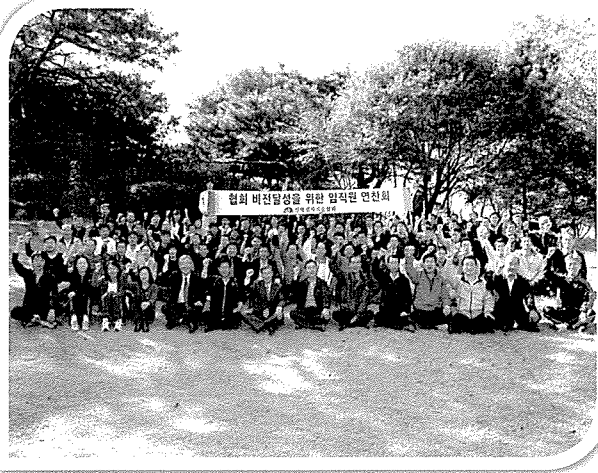
▲ 협회는 본부 및 전국지부를 3개 권역으로 나누어 협회 비전달성을 위한 임직원 연찬회를 개최하였다. (사진은 본부권역 연찬회 전경)