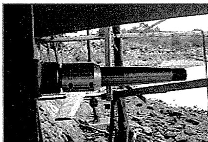
- 선박 프로펠러 축에 부착한 방식시스템 -

[그림2]는 실험에 사용한 직경 90mm의 희생양극과 FRP 소형선박에 설치된 희생양극 형상을 보여주고 있다.