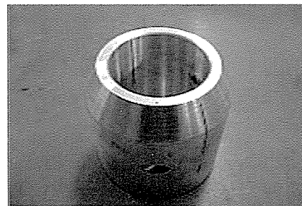
- 선박 프로펠러 축에 부착되는 알루미늄 희생양극 -