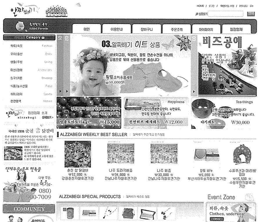
▲ 2005년 9월부터 온라인 쇼핑몰 이용을 통해 현재 1,000여명의 회원을 확보하였으며 정기적인 메일 발송 등을 통해 자활상품 소개 및 자활소식을 전하고 있다