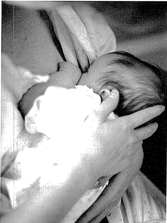
임신전에 정상혈당을 유지해야 성공적인 출산을 할 수 있다

신장기능은 현성신증이 있는 당뇨병여성이 임신 후 떨어질 수는 있지만, 신장기능이 감소하는 비율(크레아티닌 청소율: 매년 10ml/min감소)은 임신하지 않은 경우와 크게 다르지 않다. 임신전에 고혈압이 있는 경우에는 즉시 치료를