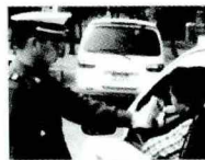
경찰용 음주측정기 AL-1100