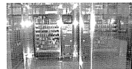
▲ 다양한 로케이션에 설치되어 있는 대형 멀티벤더 CVM-5049S