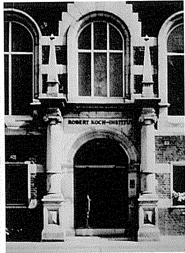
코흐가 결핵균 연구를 했던 연구실.