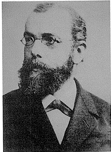
세계 최초로 결핵균을 발견한 로버트 코흐.