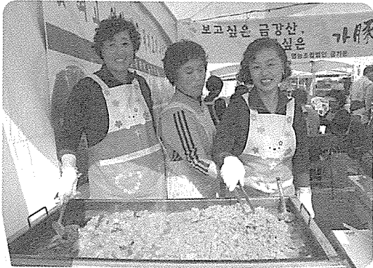
▲ “고추장 돼지고기 불고기 맛좀 한번 보실래요.” 시사회에 직접 포천지부 회원들이 함께 했다.