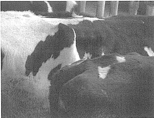
〈그림 1〉 부착된 승가확인제가 승가에 의해 붉게 발색된 모습

발정관찰의 어려움을 덜기 위해 다양한 발정발견 보조기구도 많이 사용하고 있는데 그중 승가확인제(Kamar사의 Heat mount detector)가 가장 많이 이용되고 있다. 이것은 등 십자부 후방에 부착해 두면 승가시 압력에 의해 속에 들어있던 잉크가 터져 나와 적색을 띄므로 멀리서도 관찰이 용이한 것이다(그림 1). 그러나 이러한 방법의 활용시 잉크가 터진 개체는 승가를 다시 하는지 혹은 질점액의 분비 등 2차 발정징후가 있는지 반드시 확인하여 발정의 정상성을 확인해야 한다. 이러한 방법의 활용으로 축산연구소에서는 70% 정도의 발정발견율을