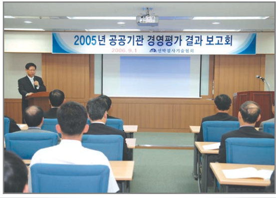
- 2005년도 경영평가 결과보고회 -

협회는 지난 9월 1일 본부 전 임직원과 전국 17개 지부장 및 지부 혁신관리자 100여명이 참석한 가운데 『2005년도 경영평가 결과 보고회』를 개최하였다.