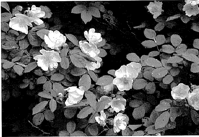
꽃이 필 무렵에 붉은색으로 보이는 찔레꽃