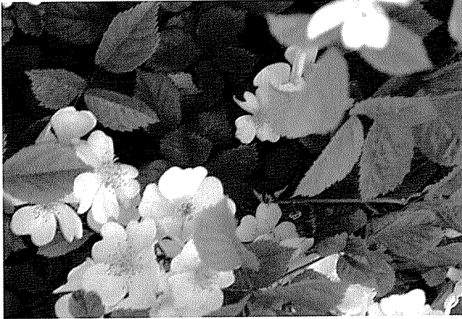
꽃의 근경. 수술이 많으며 화분도 많다. 노랗게 보이는 것이 새로 핀 꽃이고, 갈색으로 변한 것은 벌이 화분을 가져간 것이다.