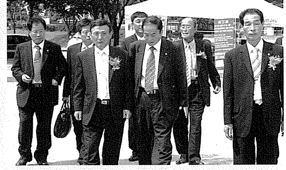
— 대구광역시 설비시공인 체련대회 — 주최: 한국열관리시공협회 대구광역시회 전국보일러설비협회 대구 광역지부 일시: 2006. 9. 10(日) 장소: 대구상서관리공단 체육공원