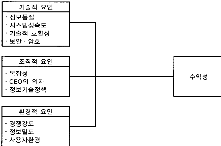
<그림 2> 본 연구의 모형

본 연구모형을 구성하는 독립변수로는 기술적 요인으로 정보품질, 시스템 성숙도, 기술적 호환성, 보안·암호, 조직적 요인으로 복잡성, CEO의 의지, 정보기술정책 등을 선정하였다. 또한 환경적 요인은 경쟁강도, 정보밀도, 사용자환경 등 3개의 요인으로 구성된다. 그리고 종속변수는 수익성 요인으로 구성되어 있다.