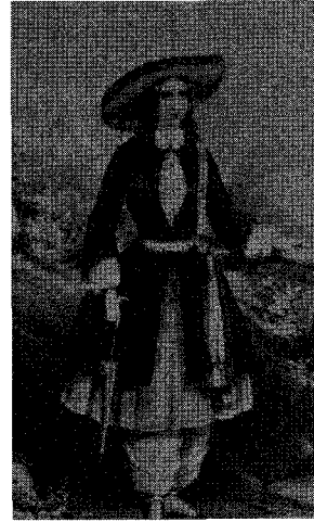
<그림 1> 블루머 카스툼 3)

본 연구자는 기존의 연구들이 운동복을 포함한 서양 여성 바지의 변천과정이나 개혁 의상의 측면에서 니커버커스를 가볍게 언급하고 지나친 점에