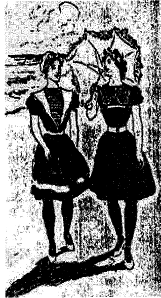
<그림 4> 1900년경 원피스형의 수영복으로 니커버커스를 스커트로 가림 37)

이러한 사회적 상황은 The New York Times 의 광고를 통해서도 확인할 수 있었다. The New York Times 에서 1907년까지 니커버커스는 소년이나 남성용 의복으로 광고되었다. 여성용 니커버커스 광고는 1908년 이후에야 확인할 수 있는데, 그림 5에서와 같이 코르셋이나 페티코트와 함께 어디까지나 속옷으로 분류되어 있다. 하지만, 이미 1902년에 시장