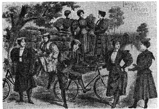
<그림 3> 19세기 말 여성 사이클링복 27)

커버커스만 착용한 “남성적인(masculine) 여성은” 혐오스럽다고 말한 바 있다. 24) 사이클링 시 여성의 니커버커스 착용에 대한 미국의 보수적인 사회적인 분위기는 1898년에도 확인되었다. 이 기사에 따르면, 유럽에서는 미국에 비해 사이클링 시 용납되는 스커트 길이가 1에서 2인치 정도 더 길었다. 하지만, 영국에서는 사이클링 시 치마 착용을 아예 반대하는 분위기였고, 독일에서는 다양한 스타일의 사이클링용 니커버커스를 착용한 여성의 모습을 광고에서 찾을 수 있었다. 반면, 뉴욕의 경우 유럽에 비해 니커버커스에 대해 너그럽지 못하였다. 25) 따라서, 소수의 여인들만이 그림 3에서와 같이 과감하게 치마를 벗어 던진 채 자전거를 즐겼고, 대부분 치마 아래 바지를 숨겨 착용하는 분위기가 20세기 초까지 지속되었다. 26)