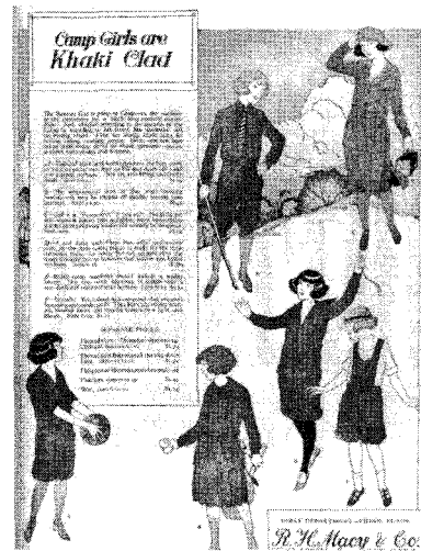
<그림 7> 1922년 니커버커스 광고 70)

여성의 니커버커스 착용에 대한 사회적인 갈등을 보고한 기사들은 1920년대 후반이 되면서 차차 사라졌다. 이는 여성들의 니커버커스 착용이 감소한 데에 기인하는데, The New York Times 에 의하면 1920년대 말이 되면서 여성들의 관심이 pajamas(파자마)나 overalls(오버롤)와 같은 다른 형태의 바지로 옮겨 갔기 때문이었다. 69) 하지만, 여성의 바지 착용은 어디까지나 운동할 때나 휴양 시로 한정되었고, 외출복으로 일반화되기까지는 더욱더 많은 시간이 필요하였다.