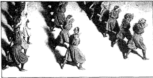
<그림 2> 1900년경의 여성 체육복 21)

상 치마와 유사하게 보이기 위해서였다고 한다. 하지만, 실내 체육관이 아닌 실외 활동 시에는 치마를 덧입어 바지를 가리는 것이 일반적이었다. 이 연구 결과를 반영하듯, The New York Times 의 1895년 한 기사에 의하면, 실외에서 열린 Vassar 대학 체육 대회에서 여학생들은 체육복인 “부드럽고 풍성한 니커버커스 또는 치마바지(divided skirt) 위에 짧은 치마”를 착용하였다고 한다. 19) 그 이후 1900년경에는 블라우스와 무릎길이의 블루머(니커버커스)가 허리에서 단추로 연결된 원피스 형의 체육복도 등장하였는데, 이는 검정 스타킹과 납작한 창의 고무신과 함께 착용되었다. 이러한 체육복 구성은 1930년경까지 지속되었다. 20) <그림 2>