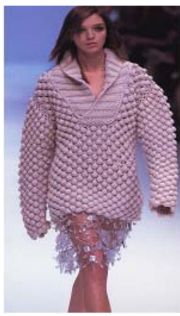
<그림 43> 모던&스포츠 티브 이미지2, '02-03 F/W, Paco Rabanne (www.fisrtview.com)