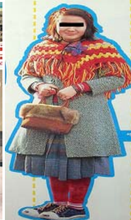
<그림 41> 히피 & 빈티지 이미지4 (유행통신, 2002.03)