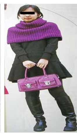
<그림 33> 페미닌 이미지4 (유행통신,2005.02)