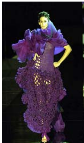
<그림 30> 페미닌 이미지1, '02-03 F/W, Gianfranco Ferre

<그림34>는 Paco Rabanne의 '02-03 F/W 컬렉션 작품으로, 가공되지 않은 듯한 매우 굵은 실을 사용한 평편 조직의 니트 스웨터와 모자이다. Paco Rabanne의 새로운 디자이너 Rosemary Rodriguez는 북유럽에서 영감을 얻은 '노르딕의 조화'를 테마로 한 해당 컬렉션에서 수공예 기법을 사용한 니트와 가죽, 모피 등을 통해 전통과 자연을 표현했다. <그림35>는 대담하고 화려한