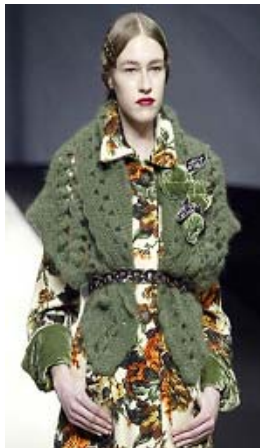
<그림 28> 친환경 추구경향, '05-06 F/W, Antonio Marras