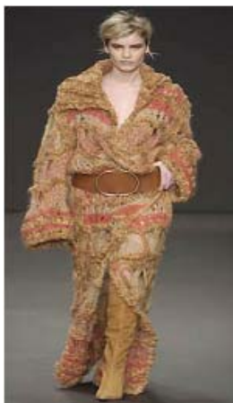
<그림 27> 럭셔리 감각 추구경향, '02-03 F/W, Mila Schon (www.fisrtview.com)

주재료로 사용되는 실의 부드러움과 니트의 장점이라 할 수 있는 우수한 드레이프성 때문에 컬렉션에 페미닌한 이미지의 작품들이 많이 나타났다. 특히 퍼프 슬리브(puff sleeve)의 풀오버나 어깨가 드러나는 스웨터, 퍼(fur)나 새틴(satin)으로 트리밍 장식한 볼레로 스타일의 카디건 등 유연하면서 인체의 실루엣을 잘 살릴 수 있는 니트의 특징이 그대로 반영된 우아하고엘레강스(elegance) 스타일, 코사지 혹은 방울을 달거나