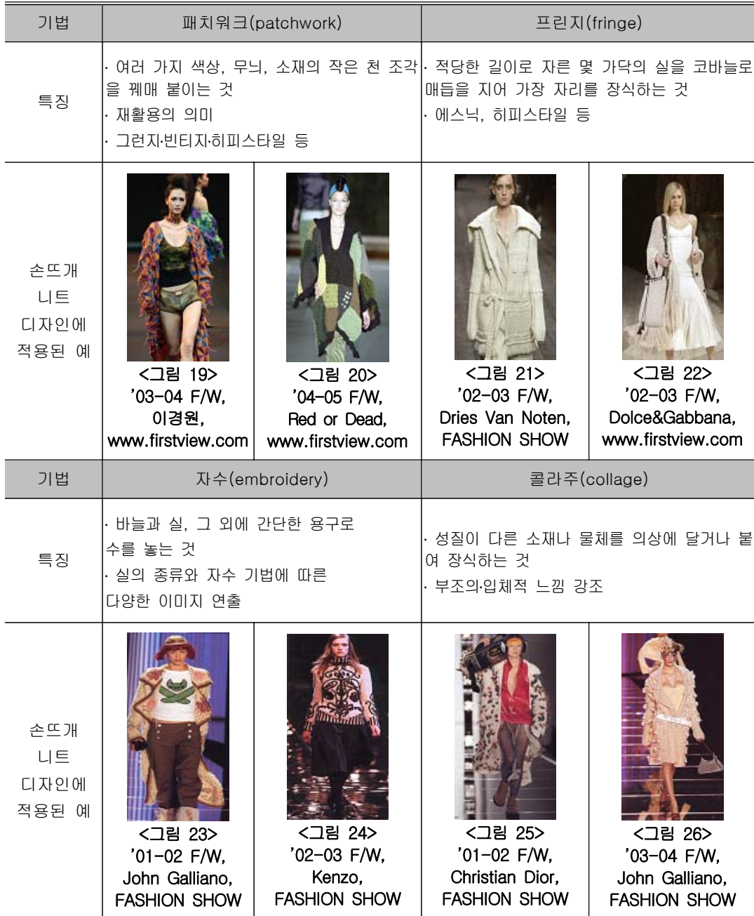
<표 2> 장식기법의 종류와 특징