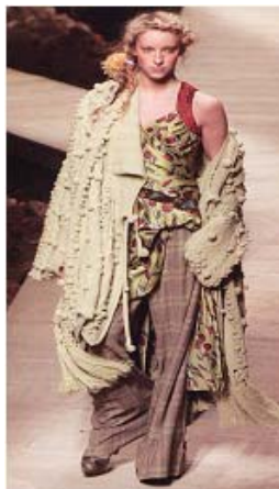
<그림 35> 에스닉 이미지2, '04-05 F/W, Kenzo (COLLECTION)