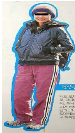
<그림 44> 모던 & 스포츠티브 이미지3 (유행통신, 2002.03.)