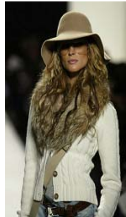
<그림 29> 믹스 & 매치 경향, '04-05 F/W, Michael Kors