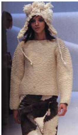
<그림 34> 에스닉 이미지1, '02-03 F/W, Paco Rabanne (COLLECTION)

이와 같은 히피 스타일은 자유와 평화를 사랑하는 젊은이의 사회에 대한 반항에서 비롯된 1960년대 말의 히피, 우아한 여성미가 강조되었던 1990년대의 네오 히피(neo-hippie), 그리고 보다 낭만적이고 고급스러운 느낌이 더해져 '보헤미안(bohemian) 스타일' 혹은 '뉴 헤리티지(new heritage)' 등으로 표현되는 2000년대의 히피까지 시대별로 약간의 차이는 있지만 꽃무늬, 데님, 구슬장식, 빈티지, 손뜨개 등과 같은 요소를 그 특징으로 하는 데에는 변함이 없다. 그 중