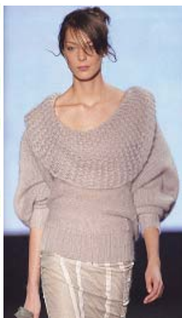
<그림 31> 페미닌 이미지2, '03-04 F/W, Stella McCartney (FASHION SHOW)