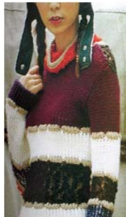
<그림 36> 에스닉 이미지3 (유행통신, 2000.09)