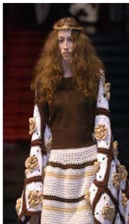
<그림 39> 히피 & 빈티지 이미지2, '02-03 F/W, Piettot