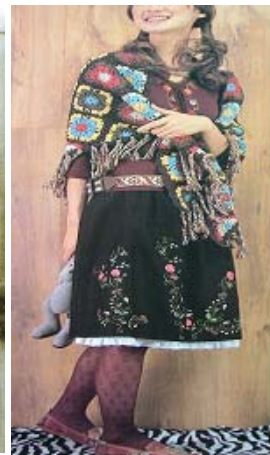
<그림 37> 에스닉 이미지4 (유행통신, 2002.12)