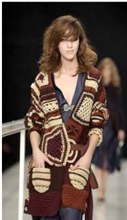
<그림 38> 히피 & 빈티지 이미지1, '02-03 F/W, Moschino

최근 많은 브랜드들이 모노톤의 컬러, 심플한 실루엣, 가죽 혹은 플라스틱과 같은 소재와의 믹