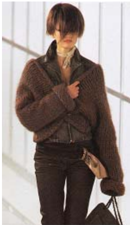
<그림 42> 모던&스포츠 티브 이미지1, '00-01 F/W, Chanel

이와 같이 손뜨개 니트 패션에서의 모던 & 스포티브 이미지는 이용된 조직과 착장 방법에 따라 심플한, 세련된, 활동적인, 중성적인 이미지 등으로 나타났다. 특히 컬렉션에서는 모노톤의 색상을 사용한 디자인이 많아 세련되고 미래적인 이미지를 주었고, 스트리트 패션에서는 레이어드 방법, 색상배열 따른 무늬의 사용 등을 통해 활동적인 이미지가 부각되었다.