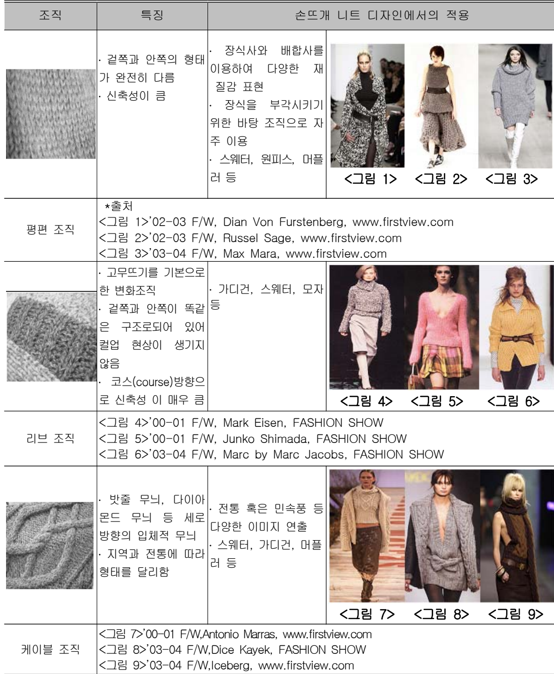
<표 1> 손뜨개 니트의 조직별 디자인 예