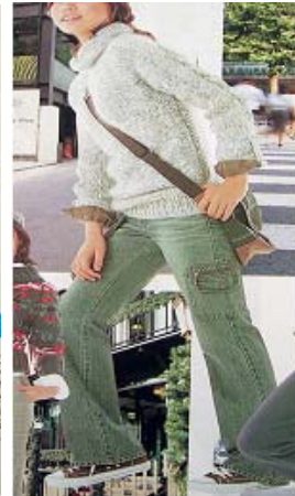
<그림 45>모던& 스포츠티브 이미지4 (유행통신, 2003.11)