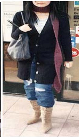
<그림 40> 히피 & 빈티지 이미지3 (삼성디자인넷, 2004.12)