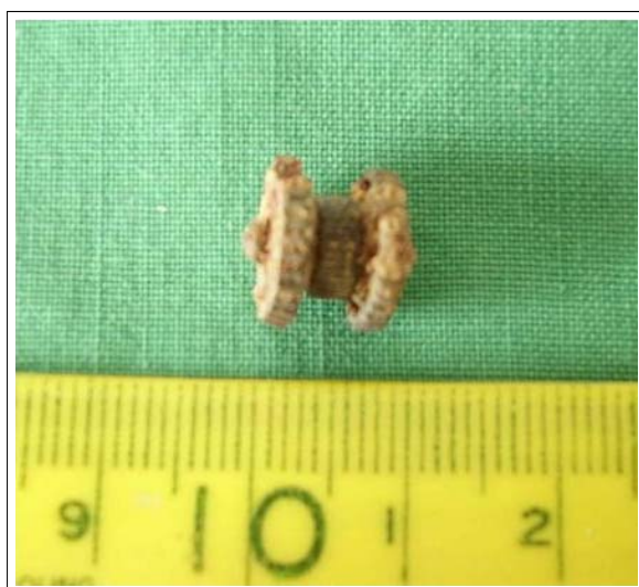
Figure 4. The photograph shows 6 x 8mm sized, rusty-colored, metallic material, which was expectorated with cough.

132.2 mEq/L, K 46.6 mEq/L, Cl 96 mEq/L이었으며 요 검사에서 Urobilinigen (+++), Protein (++) , glucose(±)이었고 혈액 응고 검사는 정상 소견이었다. 항산균 객담 도말 검사 상 음성 이었고, 객담 배양 상 음성이었다.