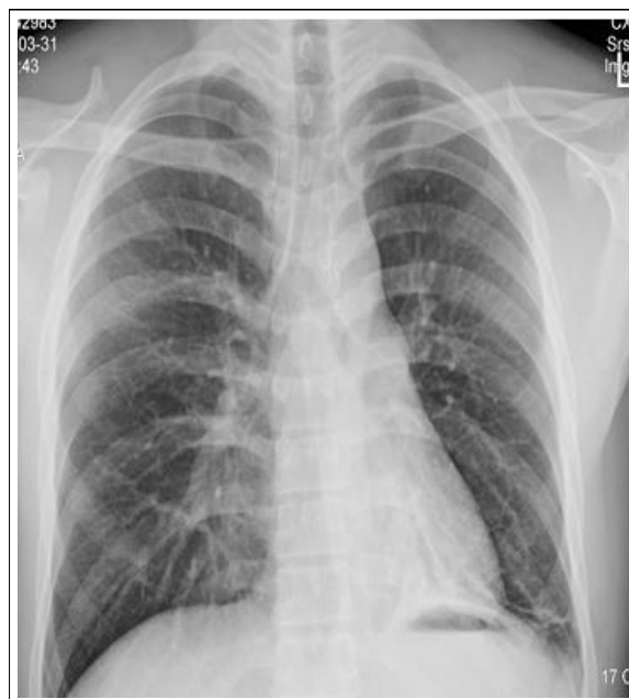
Figure 5. Two weeks later. Chest X-ray shows disappearance of radio-opaque foreign body in left Main bronchus and nearly normalized findings.

에서 좌측 주 기관지에 방사선 비 투과성의 이물이 보였으며 좌측 폐 하부에 음영이 증가하였다(Figure 1A).