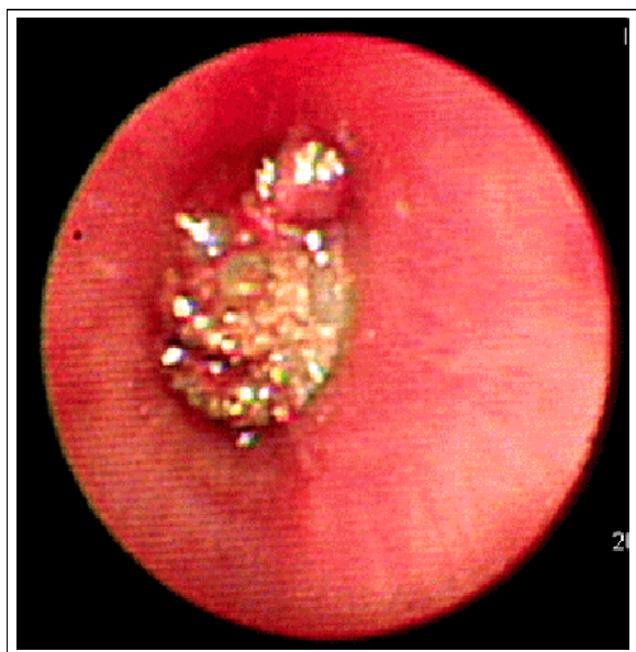
Figure 3. Bronchoscope shows foreign body covered with mucoid material obstructing left main bronchus.