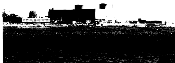
<그림 2> 고리 원자력 발전소

2005년 현재 가동중인 국내 원자력 발전소 현황은 <표 1>과 같다. <그림 2>, <그림 3> 그리고 <그림 4>는 우리나라 대표적인 원자력 발전소들의 전경이다.