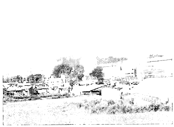
〈그림 4〉 영광 원자력 발전소