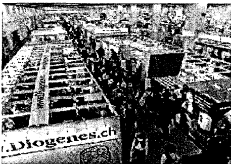
Korea, the Feast of Honor at the 2005 Frankfurt Book Fair, is in the spotlight on the world's biggest cultural stage. By Kristen Kanning, Correspondent

Listening Training을 위한 학습방법으로 인터넷 뉴스를 듣고 뉴스 내용에 근거하여 표나 도표를 완성 할 수 있다. 뉴스의 대의와 주제를 파악하도록 하여 주요 어휘와 표현을 이해하고 활용할 수 있다. 멀티미디어 활용 도구로는 인터넷 뉴스 사이트( http://cdlponline.org/news/html )와 영어 신문 사설과 파워 포인트 자료가 있다.