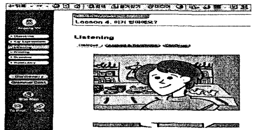
그림 1 학습자의 인지구조

인터넷이나 웹을 통한 영어 학습의 장점은 컴퓨터의 다양한 멀티미디어 자료와 이러한 자료를 무한대로 반복 재생 할 수 있다는 사실이다.