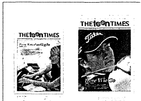
그림 6 English News Paper

인터넷 영자 신문의 정보를 통해 영어 reading skill 훈련을 위한 학습의 장을 마련한다. 인터넷 영자신문의 읽기를 통해 정보의 내용을 파악한다. 신문의 머리기사로 전체 기사내용을 추측할 수 있다. 기사 내용을 또한 간단하게 요약하여 발표하도록 한다.