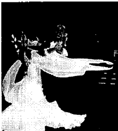
<그림 9> 모던 댄스 의상.

모던 댄스 의상인 <그림 9>는 스커트 부분이 여러 겹의 얇은 쉬폰으로 구성되어 있어 모아레 효과를 주며 아울러 스커트가 플레이 되면서 자연스럽게 생기는 주름들이 댄스의 발 동작과 함께 아름답게 흔들려 러플과 같은 울동미를 보여준다. <그림 10>은 술 장식을 사용한 라틴 아메리카 댄스 의상인데, 리드미컬하게 움직이는 댄스의 동작에 따라서 움직이는 술 장식이 자유롭게 흔들리면서 경쾌한 울동미를 느낄 수 있으며 댄스 동작을 시각적으로 강조하는 효과를 낼 수 있다.