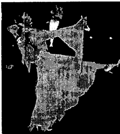
<그림 7> 모던 댄스 의상.

의상과 함께 장식의 목적으로 액세서리가 많이 사용되었는데 초커(choker)와 팔찌, 목이 긴 장갑, 장식 벨트, 머리 장식 등을 볼 수 있다. 특히 모던 댄스 의상에서 초커는 의상의 일부분처럼 사용되었는데 초커의 뒷목 부분에서 시작되어 등을 지나 손목으로 또는 소매나 허리로 연결되는 드레이퍼리가 부착되어 있다. 이러한 드레이퍼리는 드레스와 같은 비치는 소재를 사용하거나(그림 5) 비즈로 된 체인을 사용하여 움직임과 화려함을 더하여 준다. <그림 7>의 여성 의상은 배드 탑에 플레이어 스커트를 결합시킨 형태로 초커와 벨트를 크리스탈 비즈로 장식했고 초커로부터 내려온 드레이퍼리가 엔젤슬리브와 연결되어 있다. 또한 스커트 부분에는 깃털로 된 술 장식이 부착되어 있어 흔들리고 움직이는 움직임감을 준다. 라틴 아메리카 댄스 의상인 <그림 8>은 백리스의 원