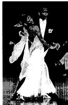
〈그림 18〉 모던 댄스 의상 (www.danceuniverse.co.kr).

〈그림 18〉은 흰색의 새틴과 쉬폰을 사용하여 피트 앤 플레이의 실루엣으로 구성된 모던 댄스 의상으로 색상, 소재, 형태면에서 모두 우아미의 조건을 갖추고 있으며, 남성의 검정색 턱시도와 대비되어 우아함을 더해준다. 〈그림 19〉의 경우, 은은한 광택의 새틴으로 된 노란색 드레스에 크리스탈 비즈 장식, 팔에 두른 같은 색의 쉬폰 소재의 드레이퍼리, 플레이어 스커트의 우아한 주름, 깊게 파여 드러난 신체 곡