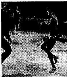
<그림 8> 라틴 아메리카 댄스 의상.

피스 형태인데 힙선에 두 가지 색의 리플을 달았고 바디스는 광택나는 비즈로 장식되어 있다.