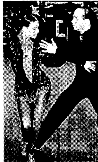
〈그림 17〉 라틴 아메리카 댄스 의상 (www.danceuniverse.co.kr).

과 함께 매치하고 있다. 노출된 신체의 피부와 함께 금속의 골드 컬러가 술 장식의 검정색과 대비를 이루면서 더욱 관능적으로 보인다. 〈그림 17〉은 앞가슴 부분에서부터 배꼽까지 길게 슬래쉬를 주어 노출시키고 헴라인을 힙선에서 잘라 전체 다리를 드러내는 신체 노출과 바치는 소재와 빛을 반사시키는 비즈 장식을 사용하여 관능적인 이미지를 표현하고 있다.