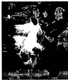
<그림 10> 라틴 아메리카 댄스 의상.