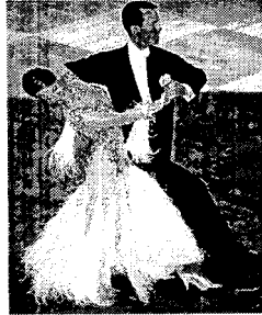
〈그림 14〉 모던 댄스 의상