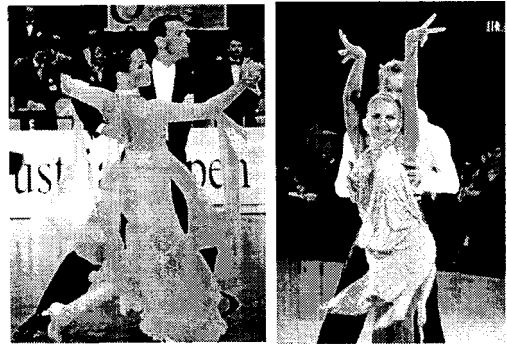
<그림 5> 모던 댄스 의상.

한편 라틴 아메리카 댄스에서는 스트레칭 소재, 광택 소재, 비치는 소재의 순으로 사용되었다. 신축성 있는 소재로 만들어진 신체에 밀착된 형태의 의상은 격렬한 라틴 아메리카 댄스의 움직임용이하게 할 뿐 아니라 착용자의 신체를 더욱 날씬하게 보이는 축소감과 아울러 분명한 외곽선을 나타내어 주며, 아름다운 신체의 선을 효과적으로 드러내 준다(그림 2). 또한 비치는 소재는 자유롭고 평화로운 인체의 순수한 자연미를 돋보이게 하기 위하여 쓰이는 가하면 감추면서 드러내어 에로티시즘을 전달하기