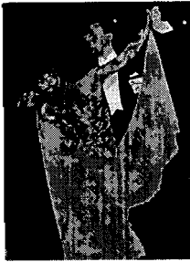
〈그림 13〉 모던 댄스 의상