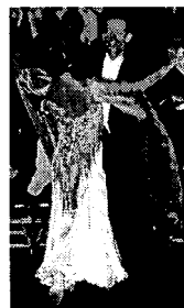
〈그림 3〉 모던 댄스 의상 (www.danceuniverse.co.kr).

유채색을 댄스 의상에 사용할 때는 각각의 색이 서로 돋보이도록 흰색 또는 검정과 투톤으로 사용하거나 보색 대비를 사용하며, 채도가 높은 색을 사용하거나 그라데이션(gradation)으로 인한 울동감을 표현하는 등의 방법으로 명시성을 높이고 있는 것을 볼 수 있다. 〈그림 3〉의 모던 댄스 의상은 흰색과 빨강을 사용하여 색채 대비 효과를 주고 있으며, 소재 자체의 광택과 비즈와 핫피스 등의 금속성 소재의