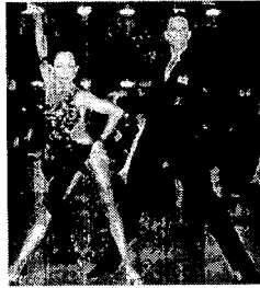
〈그림 12〉 라틴 아메리카 댄스 의상.

허리, 팔, 다리 등을 직접적으로 노출하고 있다. 두 댄스 의상은 노출과 밀착, 소재의 투시를 통하여 건강한 피부와 단련된 인체근육의 움직임을 보여주어 역동적 에너지를 느낄 수 있게 하며 아름답고 유연한 여성의 인체미를 표현하고 있다.