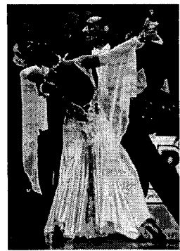
〈그림 19〉 모던 댄스 의상.