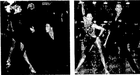
〈그림 11〉 모던 댄스 의상 (www.danceuniverse.co.kr).