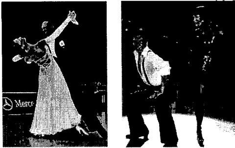
〈그림 1〉 모던 댄스 의상 〈그림 2〉 라틴 아메리카 댄스 의상. 댄스 의상.

하거나 비즈나 드레이퍼리를 사용해서 장식하는 등 의상의 후면 디자인에 강조점을 둔다.