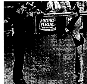
〈그림 4〉 라틴 아메리카 댄스 의상 (www.kdcf.org).