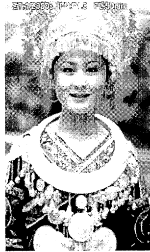
〈그림 4〉 묘족 검동형 여자 복식.

표현 방법과 문양 장식으로 대표적인 표현 방법인 자수, 도화(挑花)와 직조, 그리고 납염(蠟染)이다. 자수는 의복의 가장자리 등 곳곳에 색체가 화려한 자수 문양을 가득 수 놓았고, 용, 봉황, 꽃마차, 사람과 여러 가지 기하학적인 문양을 구성하여 변형 혼합하면서 자수하였다. 도화는 도(挑)라고도 하며 면이나 목면의 실을 바탕의 위사와 경사로 짜진 망목을 따라 자수하여 디자인을 나타내는 공예이다. 납염은 ‘점납만(點蠟幔)’ 혹은 ‘납직(蠟織)’이라고 부르며 제작방법은 먼저 밀랍으로 천에다가 그림을 그린 후에 그것을 염색하고 염색이 다 된 후에 납을 제거하면 무늬가 보인다. 납염은 백색, 남색 두 가지 색이 많고, 어떤 지역에서는 채색 납염도 있는데, ‘구도(構圖)’는 꼭 차고 문양도 다채롭고, 점, 선, 면의 구성의 밀도 관계에 차중하여서 소박하고 고상한 느낌을 준다 29) .