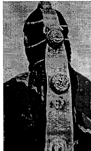
〈그림 3〉 장족 전통적인 장신구.

남녀 모두 긴 머리카락을 묶아서 각종 장식을 했다. 미혼 여자는 수삽 가닥으로 머리를 묶고, 반구형(半球型) 은장식(그림 3), 산호(珊瑚), 마노(瑪瑙)와 옥(玉) 등을 길게 이어서 장식한다. 뿔모양의 머리 장식은 나무와 천 등을 사용하여 형태를 만들었고, 터키석이나 호박 등의 보석으로 화려하게 장식했다. ‘파주(巴珠)’라는 머리 장식이 있는데 삼각형과 궁(弓)형의 장식품으로 머리에 뒤집어 썼는데 산호(珊瑚), 마노(瑪瑙)와 진주(珍珠)등의 보석이 군데군데 장식