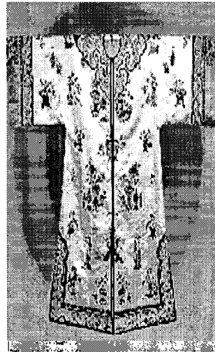
〈그림 2〉 만족 여자의 장의.

신발은 만족의 특색이 잘 나타나 있으며, 각종 수피(獸皮)로 만들었고 나중에 여름에도 포혜(布鞋)를 사용했는데, 한족과 달리 만족의 포혜는 밑바닥이