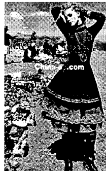
〈그림 8〉 위구르족 복식 구성이 나타난 중국 현대 복식.