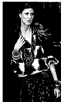
〈그림 10〉 묘족 전통소재 남염으로 된 디자인.

〈그림 11〉의 의상은 전통적인 남염 옷감으로 설계된 상의이다 소수 민족이 사용할 수 있었던 염료의 종류가 많지 않았기 때문에 전통적인 남염 옷감은