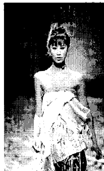
〈그림 9〉 2003 중국 국제 패션대회.

식을 있는 상의로, 옷의 가장자리부분이 불규칙적인 디자인으로 되어 있다. 전체적인 보면 조선족 민족 복식의 아름다운 감각을 연출하였다.