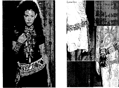
〈그림 12〉 장족 장신구 〈그림 13〉 장족 전통 벨트 특징을 지닌 목걸이. 특징을 지닌 현대 벨트

본 연구는 중국 현대 복식에 나타난 중국 소수 민족 복식의 특징을 고찰·분석하고자 함에 그 목적을 두었다. 최근 중국 소수 민족 복식의 민족성과 다양성을 중국 현대 복식에 영감을 제공하는 중요한 단서가 되고 있으며 소수 민족 복식 문화는 중국 역사와