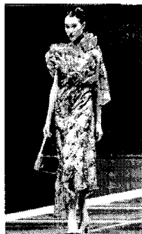
〈그림 7〉 2002 S/S.

〈그림 9〉는 2003년 중국 국제 패션대회에서 나타난 조선족 복식 구성 특징을 보였던 디자인이다. 상의의 경우는 흰색 자수를 있는 실크로 만든 주름 장