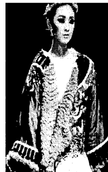
〈그림 11〉 2001 중국 국제패션대회.