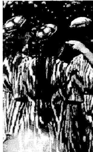
〈그림 5〉 묘족 전통적인 원피스.

신발로는 가죽신을 즐겨 신었는데, 신발 곁에 덧신 즉, '투혜(套鞋)'를 신는 습관이 매우 독특하다. 위구르족 남녀는 모두 투혜를 신는 습관이 있으며, 특히 노년층과 종교 인사들이 많이 사용하였다.