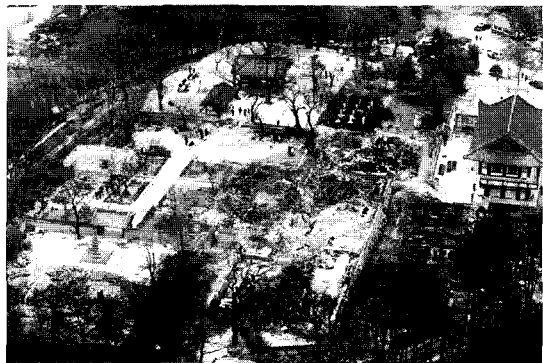
그림 2. 폐허가 된 낙산사(중앙일보, 2005/04/06)

하여금 친히 산림을 점검하고 부근에 살고 있는 백성들로 나누어 맡아 보게 하여, 만일에 불을 놓는 자가 있으면 즉시 와서 알리어 중한 죄로 벌하게 하고, 그것을 알리지 않는 자는 그 불놓은 사람과 연좌(緣坐)하게 하며, 단지 목마장에서 불을 놓아 벌레가 생기지 않을 때에만 불을 태우도록 하소서.” 화전을 위하여 산에 불을 놓는 것을 중하게 다스리되 말을 키우