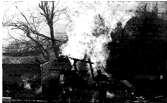
그림 1. 강원 속초시 아산에서 발생한 산불이 강풍을 타고 번져 한 주택이 불길에 휩싸여 있다.