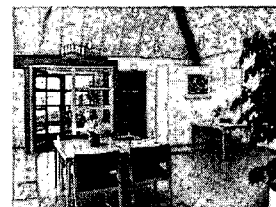
<그림 3> 덴마크의 크레아티브 시니어보 노인용 코하우징의 공동생활시설 내부