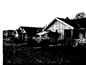
<그림 1> 스웨덴 시니어고든에서 설립한 솔로젠 노인용 코하우징 전경

본 연구에서 논의될 노인용 코하우징 단지는 덴마크의 경우에는 14개 조사대상 단지 모두 미래주민들이 자치적으로 설립모임을 가지고 나중에 지방정부의 도움을 받아서 설립된 “주민 주도형” 설립단지이고, 스웨덴의 경우에는 지방정부 산하 공영임대주택 회사조합인 SABO (11개 단지)와 스웨덴 유수의 민영주택회사인 JM회사 산하의 시니어고든(Seniorgården)에서 설립한 단지들 (8개 단지)로서 “지방정부 주도형”과 “민영회사 주도형” 설립 단지들이다. 즉 덴마크의 경우에는 설립주체가 미래주민이므로 “주민 주도형” 설립단지인 반면, 스웨덴의 경우에는 SABO는 “지방정부 주도형”, 시니어고든은 “민영주택회사 주도형” 설립 단지이다. 소유권에 있어서는 덴마크는 임대, 개인소유, 조합소유 등 다양하고, 스웨덴의 경우에는 SABO는 임대, 시니어고든은 개인소유이다.