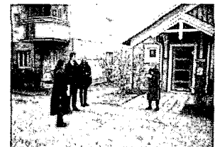
<그림 4> 스웨덴 그림스타 노인용 코하우징 공동생활시설 앞의 주민들