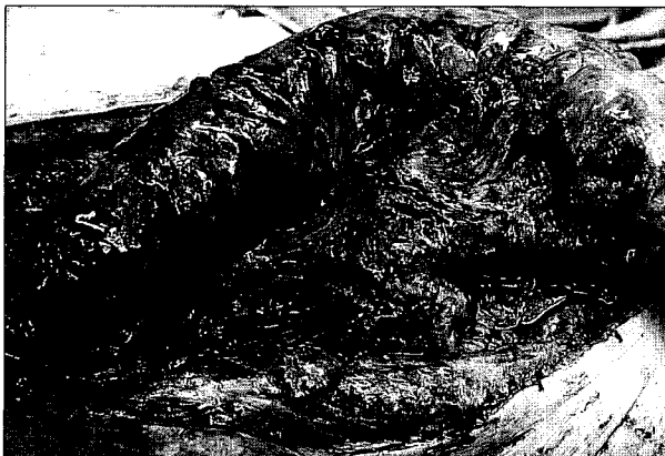
Fig. 2. Intraoperative view showing the left colon segment with pedicle, left colic artery.

하행대장 및 이 부위를 담당하는 혈관경이 완전함을 확인한 뒤 대장유리피판 전위를 시행하기로 하였다. 좌결장동맥(left colic artery)을 혈관경으로 하여 좌측 대장을 약 20 cm의 길이로 채취하였다(Fig. 2). 이후 중결장동맥(middle colic artery)의 지배를 받을 것으로 예상되던 횡행대장의 허혈성 소견이 관찰되어 모두 절제한 뒤 남아있던 회장과 직장을 문합하였다.