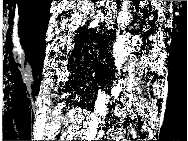
Fig. 2. The bed-log damaged by Hypoxylon truncatum .

중량감소율 조사에서는 고온성 균주와 저온성 균주 모두 보존균에 비해 분리균의 성장력이 떨어지는 ‘톱밥배지에서의 성장력’ 조사에서와 유사한 결과를 나타냈다 (Table 4). 고온성 분리균은 보존균에 비해 20.1% 정도 중량감소율이 낮았으며, 저온성 분리균도 보존균에 비해 19.0% 정도 낮은 것으로 나타나 고온성 균주들과 비슷한 중량감소율 차이를 보였다. 잡균에 오염되지 않은 상태로