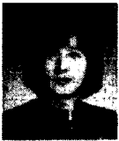
전 성 미