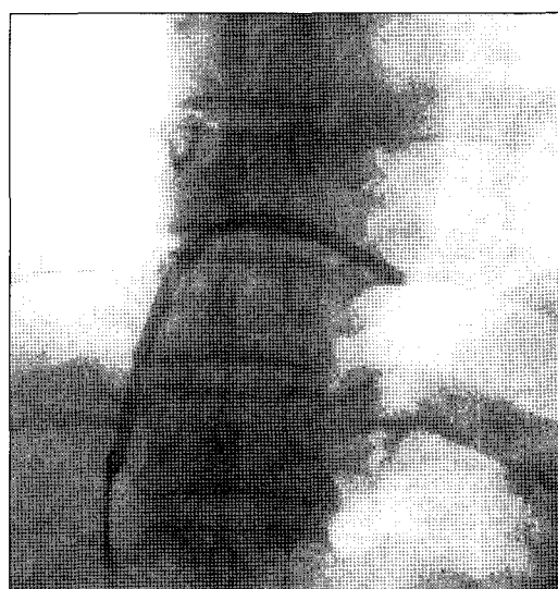
Fig. 2. Percutaneous retrieval of embolized catheter fragment.

도관을 설치하는 데는 직접 정맥을 절개하여 거치하는 방법과 introducer kit를 이용한 정맥천자 방법, 이 두 가지가 많이 사용된다. 그중 1983년 Aiken 등에 의해 처음 소개된 ‘peel-away’ sheath를 이용한 방법은 도관을 빠르게 삽입하는 데 도움을 주었다[2]. 일년 뒤, Aiken 등은 도관이 첫 번째 늑골과 쇄골 밑을 지나는 부위에서 좁아져 있는 것을 발견하고 pinch-off sign이라고 기술하였다[3]. Koonings와 Given은 100명의 환자를 후향적 조사를 하여 도관의 완전절단 없이 pinch-off sign을 보이는 경우가 5%라고 보고하였다[4]. Koch 등은 1,500명의 환자의 후향적 조사에서 합병증이 없는 경우가 87%라고 보고하였다[1]. 흔한 합병증으로는 감염(4.8%), 혈전증(3.2%), 위치이상(2.4%) 등이었다. 도관의 완전 절단은 아주 드문 합병증으로 약 0.2%정도에 해당된다. 1990년 Hinke는 방사선학적으로 도관의 비틀림의 정도를 구분하였는데(radiographic catheter distortion scale) grade 0는 도관이 첫 번째 늑골과 쇄골 사이에서 좁아짐 없이 완만한 곡선을 이루고 있는 것을 말하며, grade 1은 내경의 좁아짐 없이 굽어져 있는 겨우, grade 2는 쇄골 밑을 지날 때 내경이 좁아진 경우(pinch-off sign), grade 3는 첫 번째 늑골과 쇄골 사이에서 도관이 완전 절단되어 도관의 원위부가 우심방, 우심실 또는 폐동맥으로 이동된 것으로 구분하였다[5].