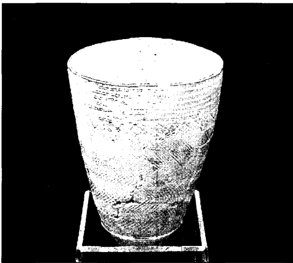
Fig. 1. 빗살무늬 토기.

그리고 그 도구는 주변에서 가장 손쉽게 구할 수 있는 재료로 만들었을 것이다. 그것이 우리 주위에 널려있는 흙으로 빚은 토기(Fig. 1)였으며 오늘날 우리가 말하는 도자기의 원조라고 할 수 있다. 도자기는 하나의 기물에 불과하다고 생각할 수도 있겠지만 좀더 깊이 있게 살펴보면 한 시대의 삶과 문화를 대변하고 있음을 볼 수 있다. 또한 그 시대 사람들의 꿈과 정신을 담고 있기 때문에 매우 소중한 의미와 가치가 있다. 필자가 학창시절 즐겨 가던 곳이 박물관이나 미술관이었는데 갈 때마다 제일 눈에 많이 보이는 유물이나 전시품이 도자기였다. 그