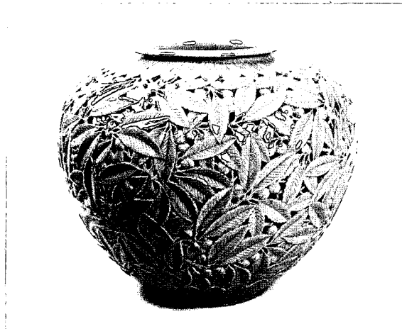
Fig. 4. 청자 이중투각 도토리문 호.

라고 하는 꽃을 공양함으로 극락에 갈 수 있을 거라고 생각했다. 그러기에 꽃을 꽃을 수 있는 화병을 비롯하여 술을 담을 수 있는 술병과 차를 마실 수 있는 다구 등 생활에 필요한 여러 가지 용기가 많이 만들어 졌었다.