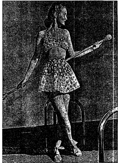
〈그림 4〉 면직물로 된 투피스 수영복 9)

여가 시간의 증가와 일거리 창출을 위한 정부의 많은 해변 공원과 수영장 건설은 수영복에 대한 관심을 증가시켰다. 또한, 당시 건강을 위한 일광욕 열풍은 진동과 목둘레를 깊게 판 수영복의 유행을 가져왔고, 등이 깊게 파인 이브닝드레스의 유행은 일