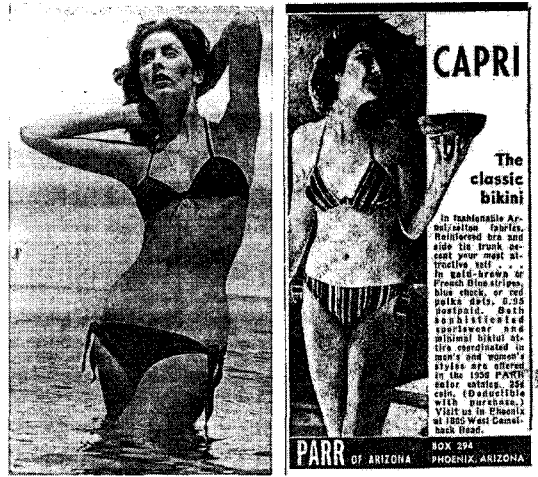
〈그림 8〉 1959년 비키니 31) 〈그림 9〉 1959년 비키니 광고 32)

The New York Times 는 비키니의 이러한 인기 원인 중 하나가 개인 수영장의 증가에 있다 하였는데, 1949년에서 1959년 사이에 개인 풀장의 수가 2,500개에서 87,000개로 증가하여 사적인 일광욕이 많은 미국인들에게 가능하게 되었다는 것이다. 또 다른 이유로는 많은 미국인의 유럽여행을 들었는데,