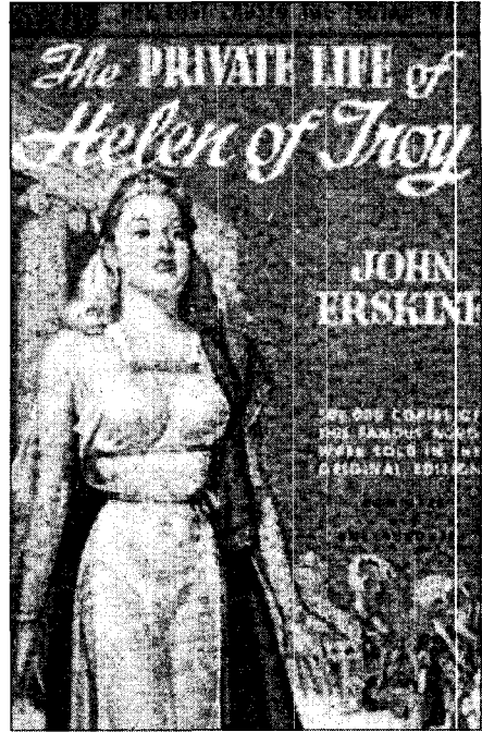
<그림 10> 1948년 Popular Library사의 nipple cover 37)

하지만, 이러한 성에 대한 직접적인 표현과 성의 상품화는 사회적 통제의 대상이 되었다. 2차 세계 대전 이후 시작된 미국과 소련을 중심으로 한 냉전 체제는 온 미국을 핵무기와 공산주의에 대한 공포 속으로 밀어 넣었다. 이러한 상황에서 가족 중심의 안정된 사회 체제의 지향은 당연한 결과였으며, 특히 반공산주의자들은 기존의 사회 체제나 가치에 위배되는 현상들에 주목하였다. 이들에게 섹스 산업이 내놓은 선정적인 상품들은 국가의 미래를 위해