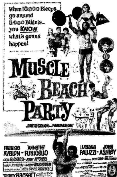
<그림 12> 1964년 영화 Muscle beach party 의 홍보물 44)