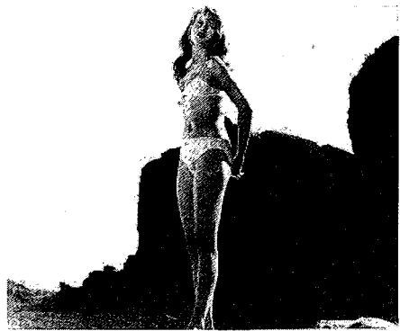
<그림 11> 1950년대 비키니를 착용한 Brigitte Bardot의 모습 43)

시선을 사로잡았다. <그림 11> 이어 1963년에서 1966년에 개봉된 Beach party , Muscle beach party , How to stuff a wild bikini 등의 beach party 영화 시리즈는 비키니의 대중화에 크게 기여하였다. <그림 12> 또한, 1962년 개봉된 Dr. No 의 본드걸 Ursula Andress와 1966년 발표된 One million years B.C. 에 원시인으로 등장한 Raquel Welch 등은 이 시기 비키니를 대표하는 우상이었다. 42)