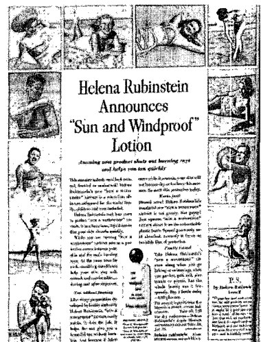
〈그림 7〉 1950년 섀로션 광고 22)