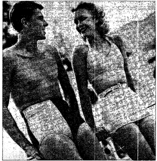
〈그림 3〉 1940년 신혼여행 중인 Reagan 부부 8)

1930년대 중반 이후 이러한 투피스 수영복의 인기가 꾸준히 상승한 배경을 살펴보자면, 우선 1920년대부터 시작된 스포츠로서의 수영에 대한 인기가 1930년대까지 지속되었다는 점이다. 1929년 시작된 대공황이란 시대적 상황에서 실직자 증가에 따른