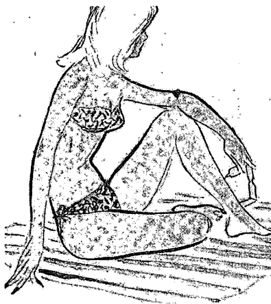
〈그림 5〉 1946년 Bazaar 에 소개된 비키니 20)

하지만 이러한 중에도, The New York Times 를 통해 소수의 자신감 있는 여성들이 1950년대 초 비키니를 착용했던 흔적을 확인할 수 있었다. 1952년 한 기사에 의하면 아파트 옥상에서 일광욕을 하려던 비키니 차림의 한 젊은 여성이 주머니쇠를 발견하고 놀라 경찰이 출동한 사건이 있었다. 26) 또한, 1953년에는 Virgin Islands of Charlotte Amalie라는