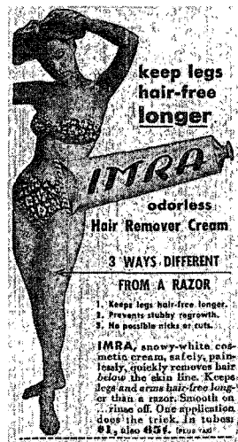
〈그림 6〉 1948년 제도제 광고 21)