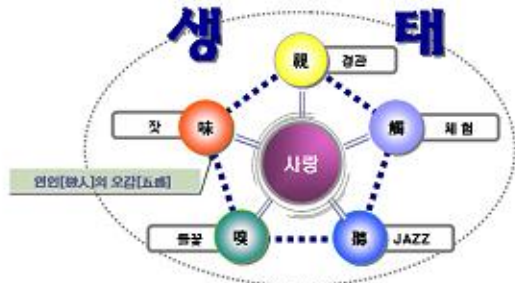
그림 2. 개발 컨셉

기본방향으로 연인산의 전설과 관광자원을 활용한 사랑과 연인산에서 느낄 수 있는 「자연속의 五感」의 요소를 접목하여 세부테마 도출할 수 있을 것이다.