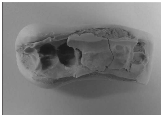
Fig. 2b. Impression taking with bite registration material.

량하였으며, 측량 후 제조사에서 제공한 밀도 표를 이용하여 부피로 환산하였다. 이렇게 하여 술 후 1.5개월과 술 후 6개월의 이식된 골 부피를 측량할 수 있었다.