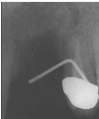
Fig. 1a. Pre-op.

이식된 골의 시간에 따른 체적 변화량을 알아보기 위해 Proussaefs 등 8) 이 제시한 방법을 이용하였다. 먼저 술 후 1.5개월과 6개월에 만들어진 모형에서 이식부 연조직을 비가역성 친수성 콜로이드를 이용해 인상을 채득하고 아크릴릭 레진을 이용해 개인 인상용 트레이를 제작하였다. 그리고 이렇게 제작된 개인 인상용 트레이에 강화형 실리콘 인상재로 이식부 모형에서 인상채득 한 후 실리콘 인상재 위에 교합 인기용 인상재를 올려놓고 술전모형에서 다시 인상 채득하였다(Fig 2a, 2b). 여분의 교합 인기용 인상재를 제거하고 교합 인기용 인상재와 실리콘 인상재를 분리한 후 교합 인기용 인상제의 무게를 측