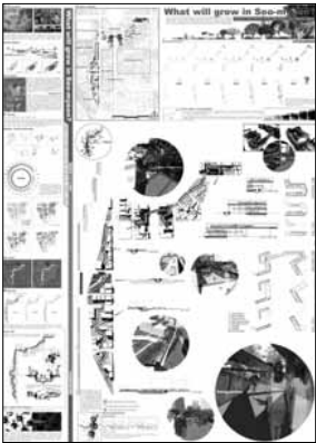
대상작 / What will grow in Seo-Myeon?

이번 공모전의 대상에는 권대근(인제대학교)씨의 'What will grow in Seo-Myeon?' 이 수상하였으며, 금상에는 심영주(동의대학교)씨의 'Artificial Landscape'와 장활제(대구가톨릭대학교)씨의 'Re-construction of Tool Shop Street', 최다문(울산대학교)씨의 'An Old Road', 이승은(동명정보대학교)씨의 'Empty', 박정석(신라대학교)씨의 'History Flow' 등 5작품이 수상하였다. 이밖에도 은상 5점, 특별상 1점, 동상 10점이 시상되었으며, 입상작도 다수 시상되었다.