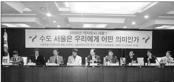
행정중심복합도시에 관한 토론회

2005부산국제건축문화제에 대해 문화체육은 문제점으로 지적된 홍보 및 인력부족 문제 등을 더욱 보완하여 앞으로 세계적인 국제건축문화제로 자리매김할 수 있도록 노력하겠다고 밝히며, 8월에 있을 국제건축워크숍과 현재 추진되고 있는 부산영상센터 초대공모전에도 많은 관심을 가져 주기를 당부했다.