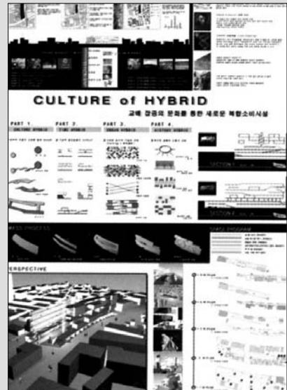
대상 : Culture of Hybrid