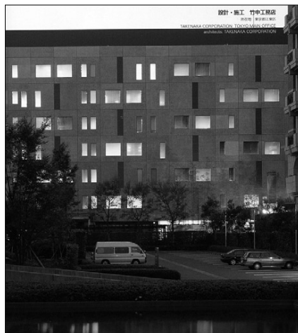
타케나카(竹中)공무점 도쿄본점 신사옥

'건축주와 함께 환경과 조화를 이루는 공간 창조를 목표로 한 건축을 만들어 가는 것'으로서 타케나카(竹中)공무점이 제창하는 것이다. 이것은 기획과 계획단계에서부터 시공, 그리고 건물의 운용시까지 전 과정에 대한 총체적인 환경품질의 향상과 환경부하의 저감을 코스트측면과 디자인 측면을 모두 포함하여 종합적으로 실현하고자 하는 것이다. 타케나카공무점의 도쿄본점 신사옥은 이 '서스테이너블 워크스'를 실천하는 장으로서 자리매김하였다.