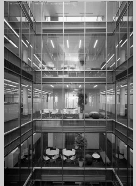
타케나카(竹中)공무점 도쿄본점 신사옥

이번 사옥 건설은 부산되어 있던 사무소를 집중하여 업무의 효율화를 도모하기 위한 것이다. 다양한 솔루션 업무의 전개에 의해 타부문의 협동작업 등 업무형태가 다양화되면서 보다 반응이 빠르고 신속한 창조적 업무전개에 대응할 수 있는 오피스공간에 대한 욕망이 커져왔다. 한편 지구 환경보전에의 방법에 대한 사회적인 요청은 급기야 긴급성을 크게 요구하고 있는 단계에까지 이르렀다. 여기서 「프로그래밍수법」에 의한 오피스 컨셉의 설정을 통해 추출된 주요한 타겟은 고효율·고품질의 워크플레이스의 구축, 환경부하의 저감과 코스트퍼포먼스의 추구였다. 이를 위하여 설비, 구조시스템과 건축디자인의 통합성을 높여 오피스 커뮤니케이션의 향상을 주요점으로 한 새로