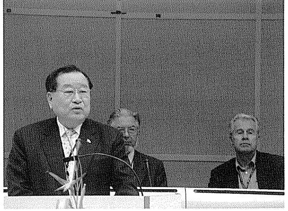
< 채화묵 협회장 차기주최국 확정 답사 >

그밖에 IRE(동위원소 생산), MDS-Nordion(동위원소생산시설등), TSR(수송전문회사), IBA(암치료 및 싸이클로트론 시설등) 및 Sterigenics(조사전문회사)등의 주재국 시설 및 기관을 방문하는 동안 각 기