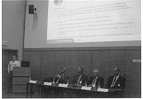
< 동위원소산업 시설 소개 >