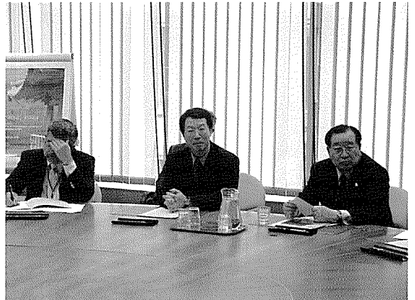
〈 차기대회 제안발표 및 평가〉