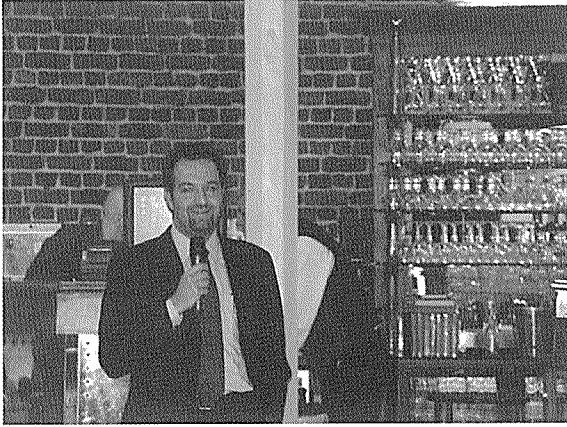
< 제6차 ICI 개최국 확정발표 >