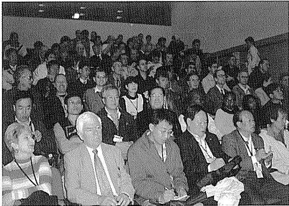
< 산업시찰 참가자 >

관의 사업현황을 소개받는 이외 각국 참여자와의 기술 및 정보교환 등으로 우리의 RT산업 진흥 기반을 구축하는 한편 국가간 협력에 많은 성과를 거두었다.