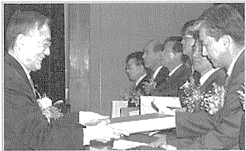
〈제37회 한국도서관상 시상식〉

총회 관련 자료(2004년도 사업실적보고, 회원현황, 2004년도 결산보고, 2005년도 예산(안), 2005년도 일반사업 계획(안), 2005년도 특별사업계획(안)와 한국도서관상 수상자 명단(공적요약 포함) 등은 본지 55-86쪽 참조.