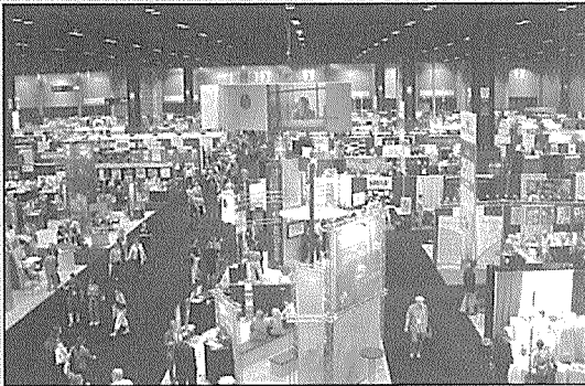
〈4,000여개에 달하는 부스의 모습〉

카에 이르기까지 세계 각국에서 ALA 연차총회에 참가한 백여 명의 참가자들이 참석했으며, 2006서울 WLIC에 관한 내용은 물론 현재 첨예하게 대두되는 도서관계의 문제에 이르기까지 다양한 화제를 거론하며 서로간의 교류를 더욱 돈독히 하였다. 이 자리에서 우리는 차기 IFLA 회장으로 피선된 Claudia Lux(임기: 2007-2009) 현 IFLA 대회 기획위원장을 만나 2006서울WLIC를 성공적으로 치를 수 있도록 몇 가지 사항을