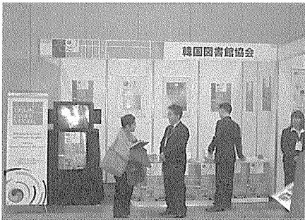
〈2006서울WLIC 홍보부스의 모습〉

행사 마지막 날인 12월 2일에는 도서관총합전운영위원회 및 Japan Culture Corporation(JCC)와의 면담을 가지고 전시회 등 도서관 관련 사업 분야에 대한 논의를 하였다. 도서관총합전운영위원회 및 JCC 측은 일본 내 130여 회원사를 대상으로 일본 기업의 전시회 참가와 기업 참관단 구성 등 서울대회를 위한 사업계획을 활발히 기획, 진행하고 있었다.