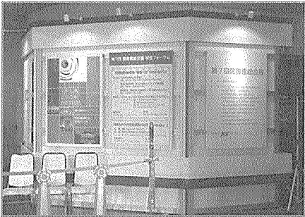
〈총합전 전시장 입구의 서울대회 로고〉

이 외에도 조직위원회에서는 총합전 기간 동안 전시장 내에 서울대회를 홍보하는 부스를 설치하고 홍보영상물 상영, 홍보자료 및 기념품을 배포하였다. 서울대회 홍보부스를 찾는 일본 도서관인은 물론 관련 업체에 이르기까지 2006서울WLIC와 한국의 도서관에 대해 많은 관심을 보였다. 서울대회 홍보부스에는 행사 마지막 날까지 500여 명의 방문객들이 꾸준히 찾아왔으며 도서관과 크게 관련이 없는 일반 참가자 및 일부 언론들도 홍보부스에 들러 서울대회의 이모저모를 묻곤 하였다.