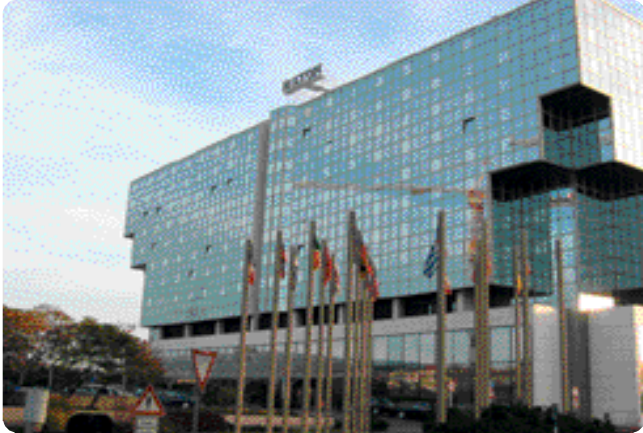
< 1. Hilton, Prague >