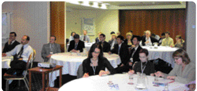
< 3. Forum E >