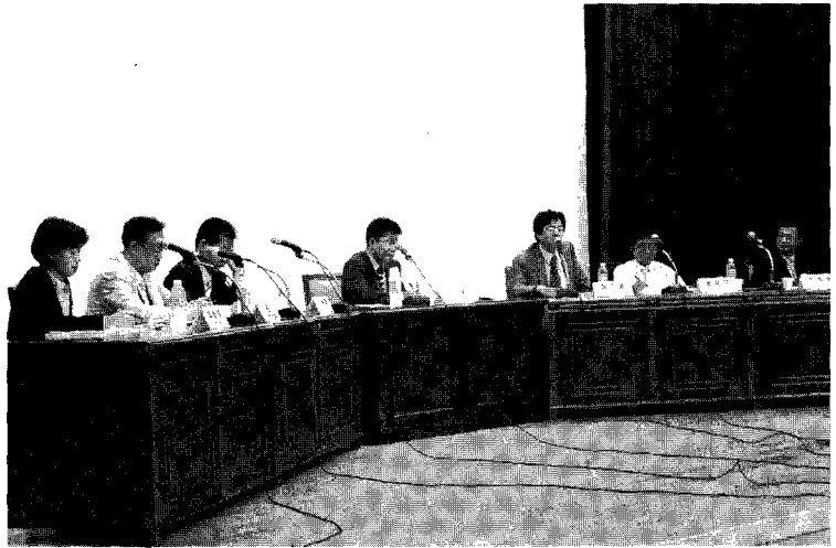
원자력 안전포럼 진행 모습

○ 정부에 대한 신뢰와 불신은 다른 현상이라는 문제 제기와 우리나라가 고불신·저신뢰 사회로서 국민의 참여가 공격적이고 파괴적일 수 있다는 발제자 의견에 대해 참가자들은 관심을 표시한 바 이에 대한