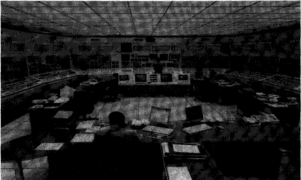
원전 중앙제어실. 한국수력원자력(주)는 2005년도에 원전 건설 및 운영 전반에 걸쳐 안전 최우선 의식을 높이고 가동 원전의 안전성을 증진시키기 위해 원전 안전성 종합 평가 및 중대 사고 대처 능력을 확보하고 국내외 기관 점검과 함께 자체적으로 안전 점검을 할 계획이다.