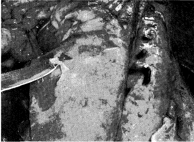
▲ 폐표면이 노란 섬유소 조직으로 덮여있다.