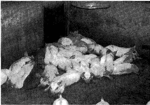
▲ 자돈들의 활력이 저하되어 있고 보온등 밑에 포개져 있다.

래서씨균( Haemophilus parasuis ), 파스튜렐라균( Pasteurella multocida type A), 연쇄상구균