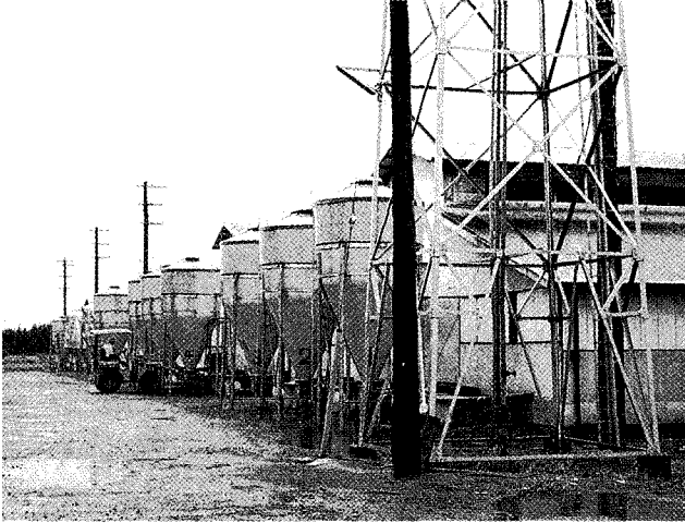
▲ 사료도 원가절감요인이 많다. 원료구입에서부터 생산 및 유통에 이르기까지 불필요한 비용은 무조건 배제해야 한다.