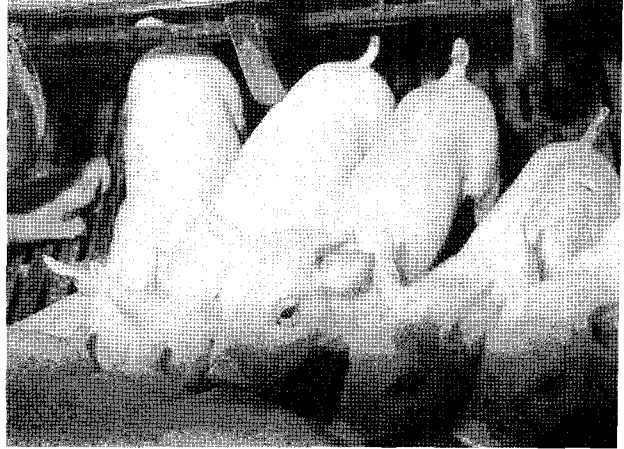
▲돼지 전염성위장염은 연중 발생하지만 주로 기온이 낮은 동절기에 많이 발생하는 설사병으로 특히 1주일 미만의 포유자돈에 발생하면 대부분의 자돈이 폐사되는 무서운 질병이다.

모돈의 분만예정일이 2주 이내인 경우는 모돈의 단체를 철저히 소독한후 분만실로 이동시키고 병원체의 전염을 차단할수 있도록 방역관리를 철저히 하여 최소한 분만 3주까지 포