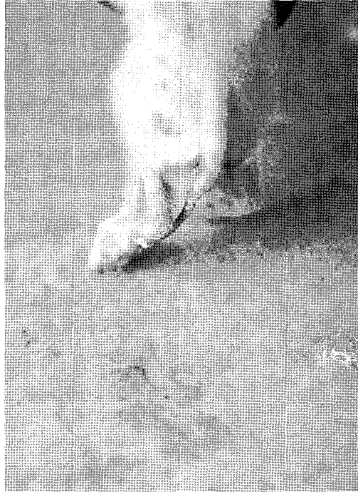
▲ 포유자돈의 설사병은 병원체에 의한 것과 면역성 결여, 환경적인 스트레스 등에 의해서 발생한다.

부터 생산된 자돈은 어미로부터 이행항체를 받으므로 수동적인 면역체가 형성된다. 이때 생시포유자돈은 초유를 충분히 섭취할 수 있도록 모든 조치를 취해야 하며 보온 및 압사 방지에 신경 써야한다. 만일 농장내에 TGE가 발생되면 인공감염을 실시하는데 이때 분만에 정 10일이전 모돈에 감염된 자돈의 장과 항생제, 우유를 혼합하여 인공감염을 실시하고 심한 경우 7일 간격으로 추가 감염시킨다.