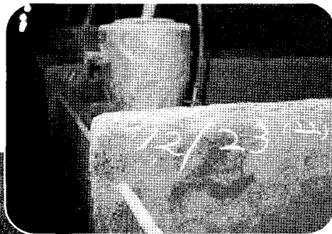
▲ 각 돈방마다 입식일이 분필로 기록되어 있다.

‘소비자에게는 맛으로 만족을! 생산자는 고급육생산을 통한 높은 수익으로 만족을! 판매