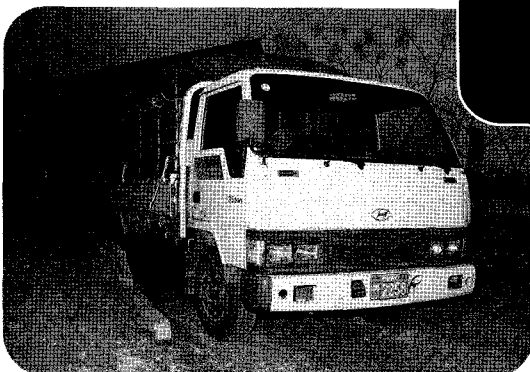
▲ 고하농장은 규모가 그리 크지 않지만, 출하차량을 보유하고 있어 당일 출하돈이 당일 도축될 수 있도록 새벽 일찍 출하가 가능하다.