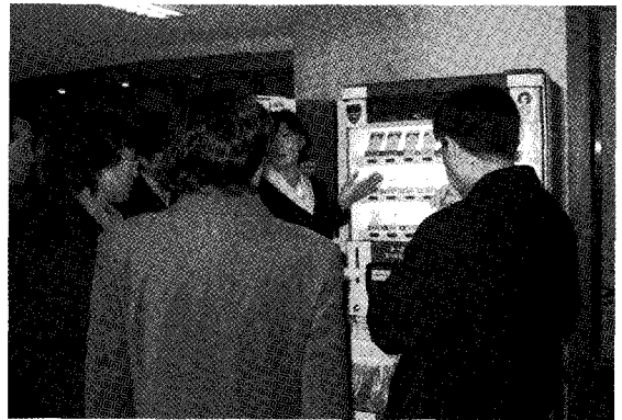
대한민국상이군경회 신생특자판기사업단 개소식 광경