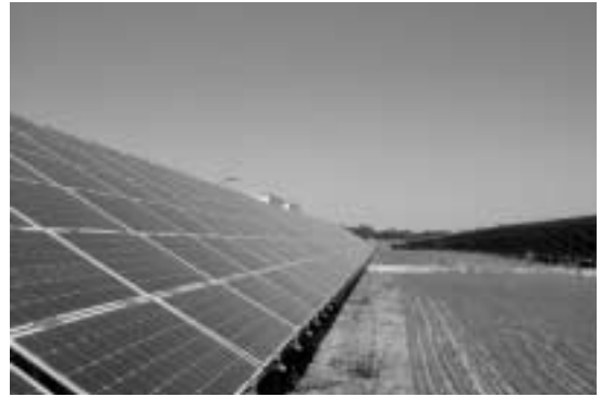
GEOSOL(태양광발전회사)의 태양광 발전단지 전경

태양광 발전단지 견학을 마치고 라이프찌히 시내의 음악의 아버지인 바하가 지휘자로 있던 성당 및 동상을 둘러 보았다. 라이프찌히는 유럽 최초의 금속활자로 유명하며, 지금도 인쇄/출판 산업이 발전되어 있