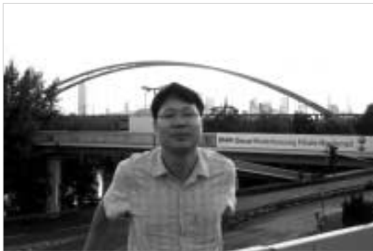
독일 프랑크푸르트 아침 전경

14시간 동안 비행기 안에서 답답하다 첫 숙소로 도착하고 보니 그제서야 이국땅의 낯선 풍경이 들어왔