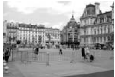
루브르 박물관 야외 전경