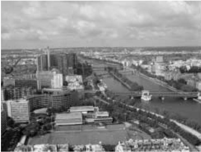
에펠탑에서 바라 본 파리 전경