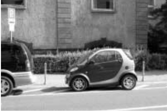
프랑크푸르트 시내를 활보하는 아주 작은 자동차