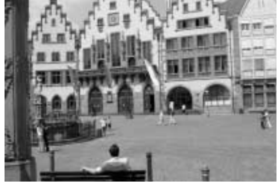
뢰퍼 광장의 시청사 건물(히틀러가 하이 히틀러를 외치던 곳)

베를린은 위도 51도에 위치하여 6월부터 10월까지만 따뜻하고, 그 나머지는 춥다고 한다. 우리가 도착하