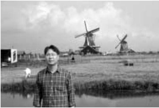
네덜란드 풍차마을인 잔세스탄스의 풍차

인들은 마늘 냄새를 시체 썩는 냄새로 인식한다고 하여 동승한 독일인들을 신경쓰면서 되도록 빨리 먹었다.