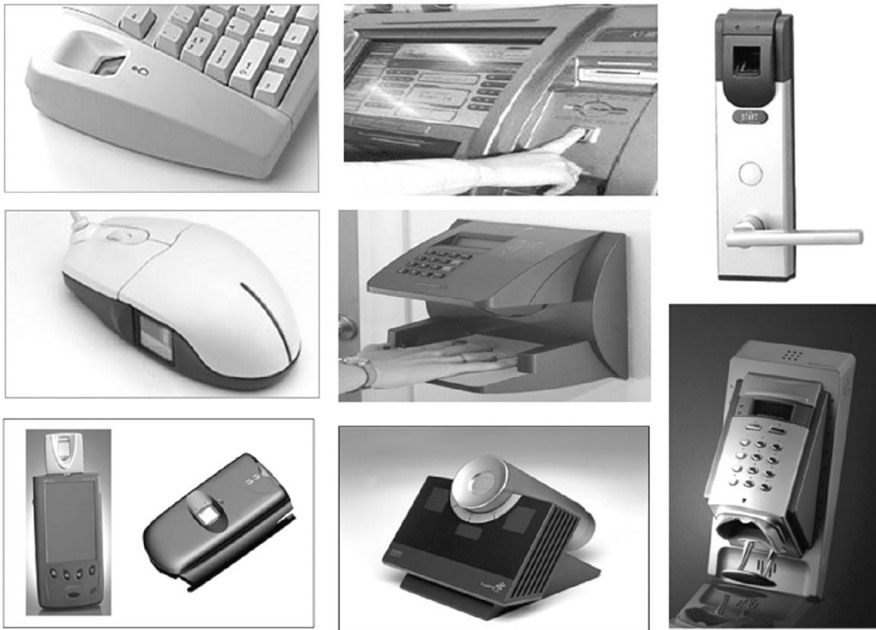
그림 4. 다양한 생체인식 관련 제품

출현할 것이다. 또한 단일 생체인식 기술의 단점을 보완하기 위해 여러 개의 생체정보를 동시에 활용하는 다중 생체인식으로 발전해 나갈 것이며, 개인 정보 유출 방지 등의 이점을 가진 스마트카드와 PKI 등 보안 연동 제품의 출현 및 전용 하드웨어 칩이 개발되어 휴대 단말기, 자동차, 총포류, 장난감 등에 탑재될 것으로 기대된다.