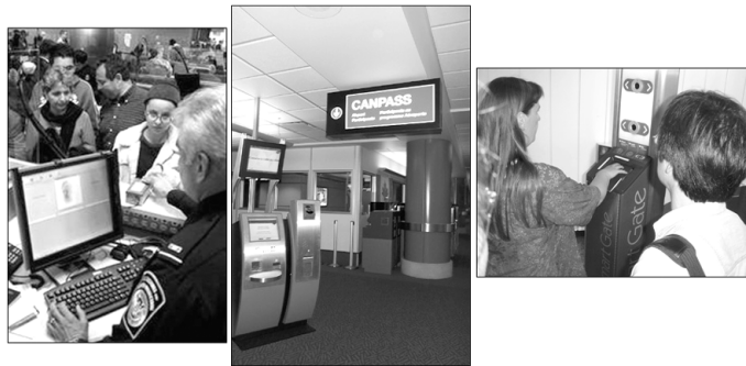
(a) 미국 US-VISIT