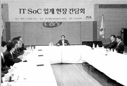
IT-SoC 업계 간담회장

진대제 정보통신부 장관은 지난 6월 24일 'IT-SoC 업계 현장 간담회'에 참석해 IT-SoC 업계를 격려했다. 이날 간담회에는 IT-SoC업계 대표 15