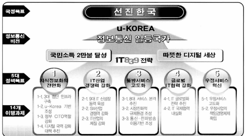
2005년 정보통신 비전 및 정책목표

유비쿼터스 사회를 주도할 8대 통신·방송 서비스를 활성화해 통신시장에 새로운 활력을 주입하고 국민의 삶의 질을 높인다. 금년중 ▲WiBro 시험서비스 실시 ▲위성 및