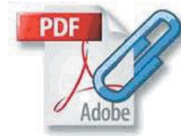
〈그림 3〉 첨부 기능 향상

특히 PDF 사용자들이 공통적으로 고민하는 부분인 파일 관리 기능을 'Organizer' 도구로 해결해 주고 있다. 'Organizer' 에서 PDF 파일을 미리 보거나 확대 축소할 수 있고 최근에 연 파일들도 체계적으로 확인할 수 있다. 또 PDF 파일을 굳이 열지 않더라도 그 내용을 검색할 수 있어 이전 Finder 검색 기능보다 검색 시간을 훨씬 단축할 수 있게 됐다.