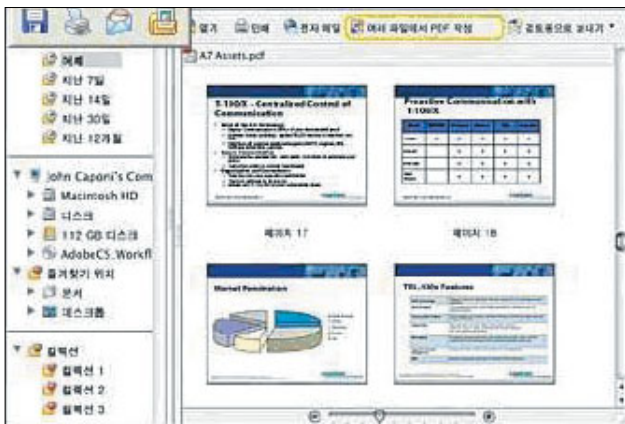
〈그림 2〉 문서 목록 구성·검색